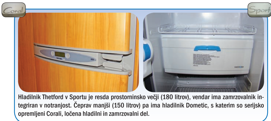
Hladilnik Thetford v Sportu je resda prostorninsko večji (180 litrov), vendar ima zamrzovalnik integriran v notranjost. Čeprav manjši (150 litrov) pa ima hladilnik Dometic, s katerim so serijsko opremljeni Corali, ločena hladilni in zamrzovalni del.