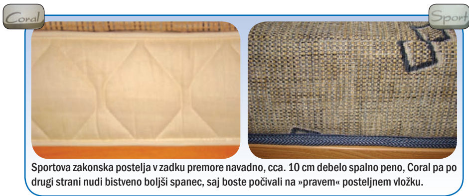
Sportova zakonska postelja v zadku premore navadno, cca. 10 cm debelo sparno peno, Coral pa po drugi strani nudi bistveno boljši spanec, saj boste počivali na »pravem« posteljnem vložku.