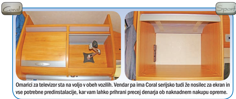
Omarici za televizor sta na voljo v obeh vozilih. Vendar pa ima Coral serijsko tudi že nosilec za ekran in vse potrebne predinstalacije, kar vam lahko prihrani precej denarja ob naknadnem nakupu opreme.