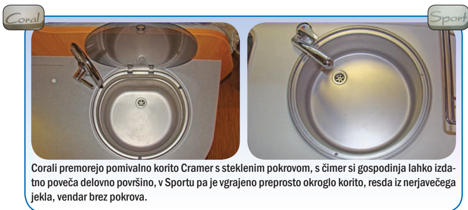
Coral premorejo pomivalno korito Cramer s steklenim pokrovom, s čimer si gospodinja lahko izdatno poveča delovno površino, v Sportu pa je vgrajeno preprosto okroglo korito, resda iz nerjavečega jekla, vendar brez pokrova.