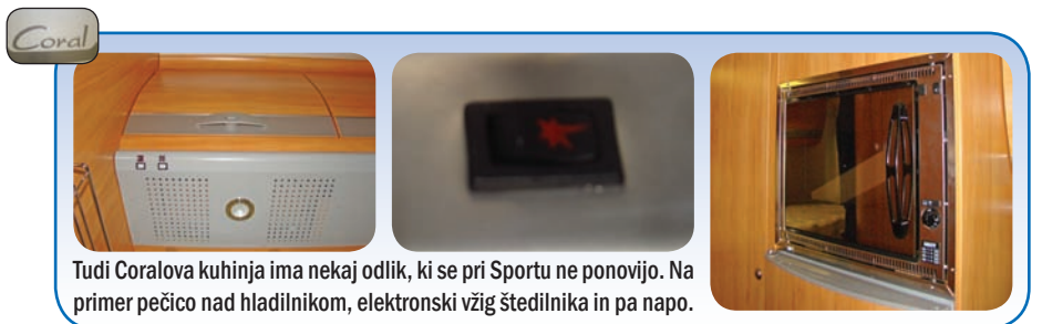
Tudi Coralova kuhinja ima nekaj odlik, ki se pri Sportu ne ponovijo. Na primer pečico nad hladilnikom, elektronski vžig štedilnika in pa napo.

NA ZALOGI ŠE NEKAJ AVTODOMOV IN POČITNIŠKIH PRIKOLIC MODELNEGA LETA 2009, PO ZNIŽANIH CENAH: ADRIA, DETHLEFFS, SUNLIGHT, SUN LIVING.