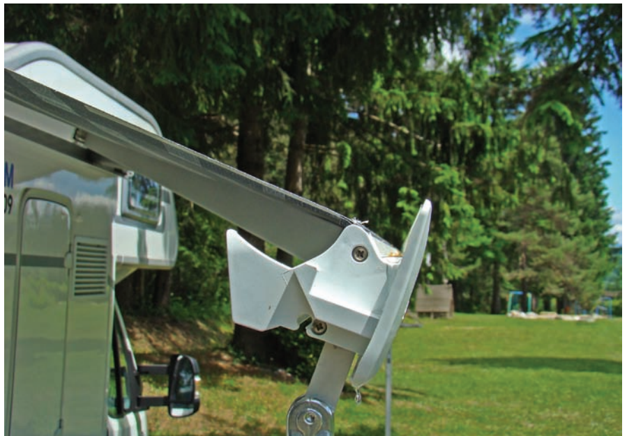
Nad izvlečnim ohišjem je žleb, ki odvaja vodo in umazanijo z markize. Ne pozabite je vsakokrat rahlo nagniti.

Izjemno močne nosilne roke markize zdržijo dvakrat večje pritiske od običajnih; zaradi širine (53 mm) in zaradi 2 kovinskih vrvi, ki še okrepita ohišje rok.