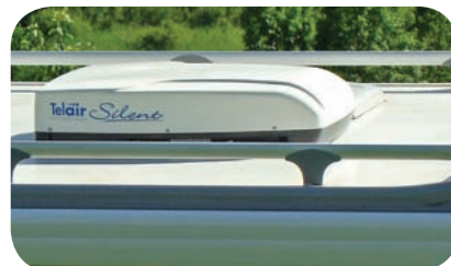
Strešna klima Telair Silent 7300H