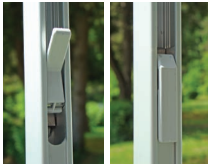
Sistem Quick-Lock zagotavlja enostavno nastavitve višine podpornih nogic, ki so sicer zložene v izvlečnem ohišju markize.

Markize sicer nismo nastavljali kakim ekstremnim razmeram, da bi lahko preskusili njene skrajne zmogljivost. Vsa- kokrat, ko je zadišalo po premočnem vetru, smo jo raje preventivno pospravili. Zato o odpornosti Omnistorja 8000 v ekstremnih pogojih ne morem podati nobenega mnenja. Razen tega, da je bolje biti preventiven kot pogumen, še posebno ko je v igri slabih 1000 evrov vreden kos opreme ... Saj za take primere seveda ne velja dveletna Omnistorjeva garancija.