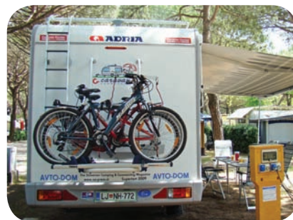
Nosilec Omni-Bike Elite za 4 kolesa